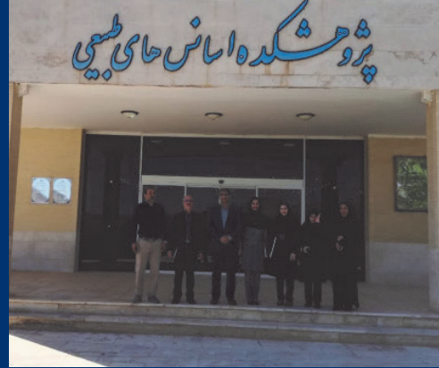
صدور مجوز تایید صلاحیت آزمایشگاه‌های کنترل کیفی پژوهشکده اسانس دانشگاه کاشان بر مبنای استاندارد ایزو ۲۵۰۱۷