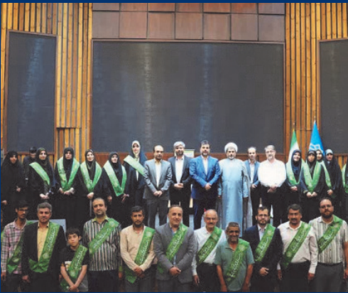
برگزاری ویژه برنامه شادیانه عید سعید غدیر «هم‌پیمان با ولی» در دانشگاه کاشان