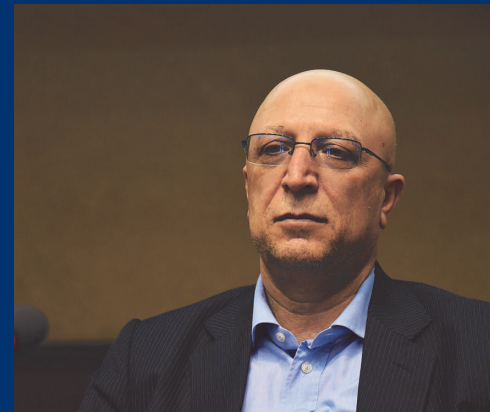
تقدیر وزیر علوم، تحقیقات و فناوری از عملکرد و اقدامات دانشگاه کاشان