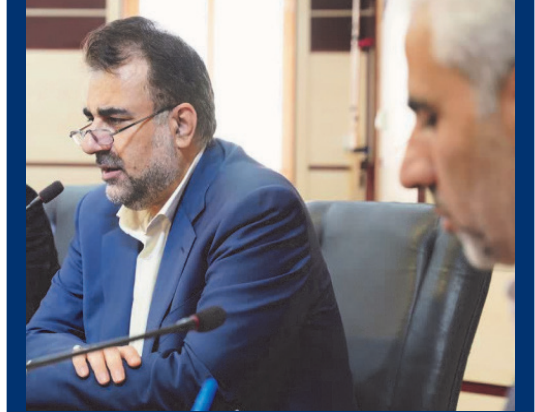
دبیر ستاد توسعه فناوری نانو: دانشگاه کاشان خاستگاه رشد و ترویج علم نانو در کشور بوده است