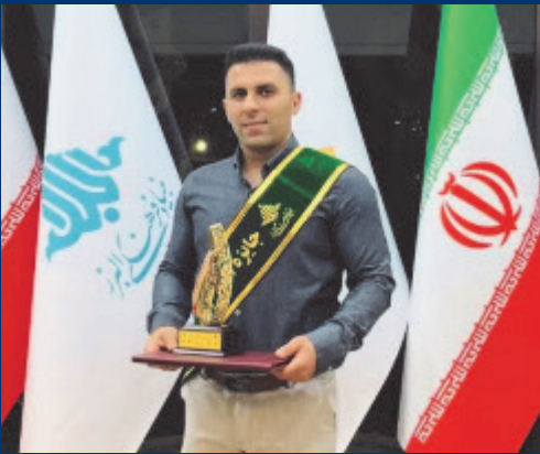
دانشجوی دکتری رشته علوم و فناوری نانو دانشگاه کاشان جایزه البرز ۱۴۰۳ را دریافت کرد