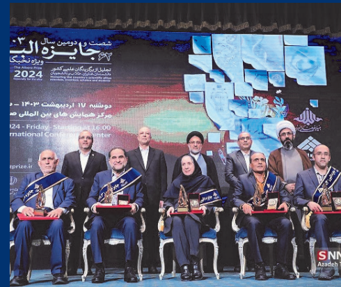
عضو هیئت علمی شیمی دانشگاه کاشان جایزه البرز ۱۴۰۳ را دریافت کرد