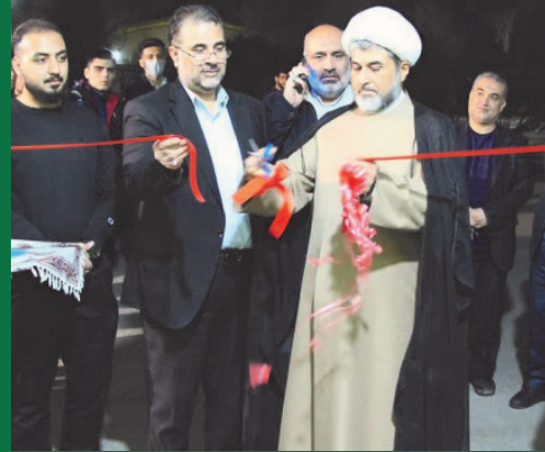
افتتاح نمایشگاه با امید تا ظهور ۳ در دانشگاه کاشان