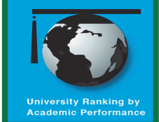
دانشگاه کاشان، پنجمین دانشگاه جامع برتر کشور در شاخص همکاری‌های بین‌المللی در گزارش نظام رتبه‌بندی یورپ ۲۰۲۳