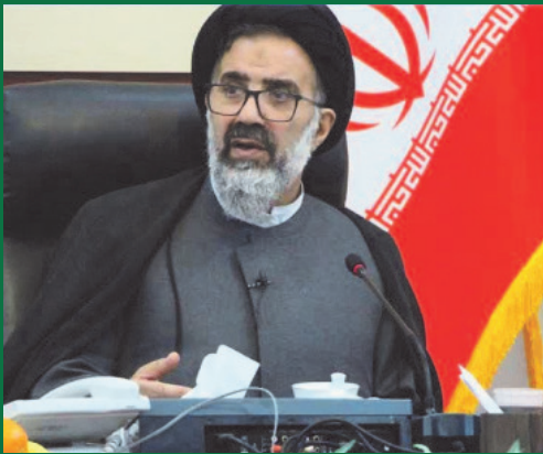
نماینده وزیر علوم در دانشگاه کاشان؛ اخلاق و قانون لازمه رشد و توسعه یافتگی دانشگاه‌هاست