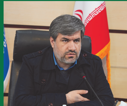
دبیر ستاد خیرین وزارت علوم: دانشگاه کاشان پیشرو و موفق در جذب خیرین است