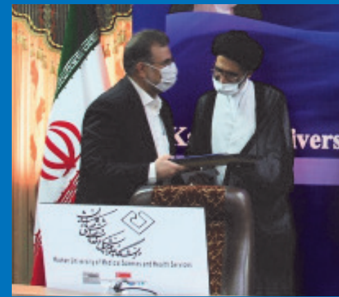
تقدیر از دانشگاه کاشان در برگزاری مراسم شهادت امام جعفر صادق (ع)