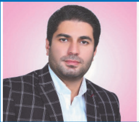
دانشکده مدیریت دانشگاه کاشان گامی در راستای توسعه کارآفرینی و اقتصادی