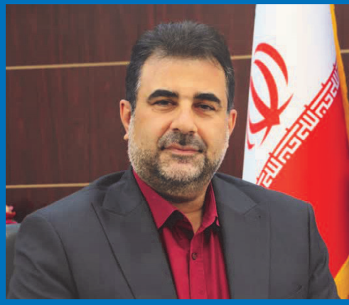
رئیس دانشگاه کاشان: