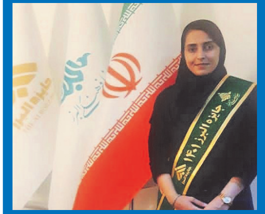
دریافت جایزه البرز توسط دانشجوی دکترای مهندسی معدن دانشگاه کاشان