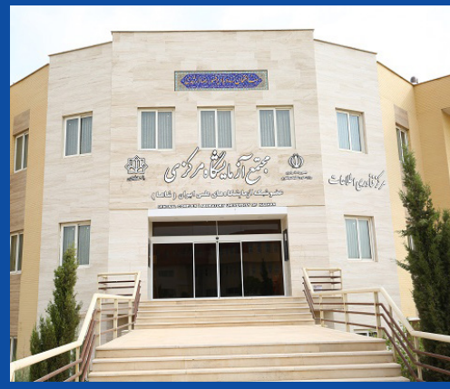
ارتقا آرمایشگاه مرکزی دانشگاه کاشان از سطح فعال به سطح توانمند