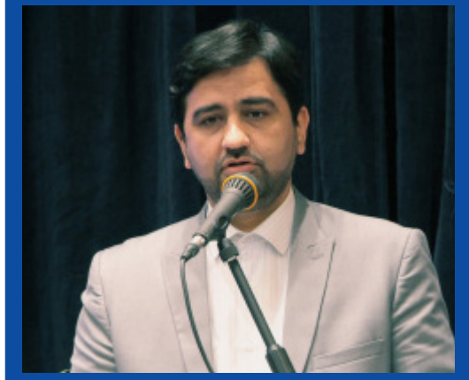
معاون اداری مالی وزارت علوم: در آمدزایی دانشگاه ها باید از تحقیقات تامین شود