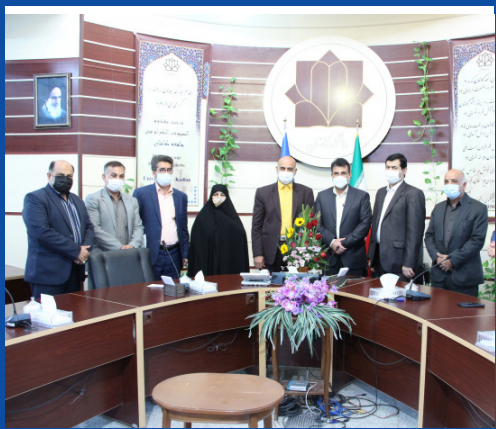
دانشگاه کاشان یاری رسان توسعه و مدیریت شهری