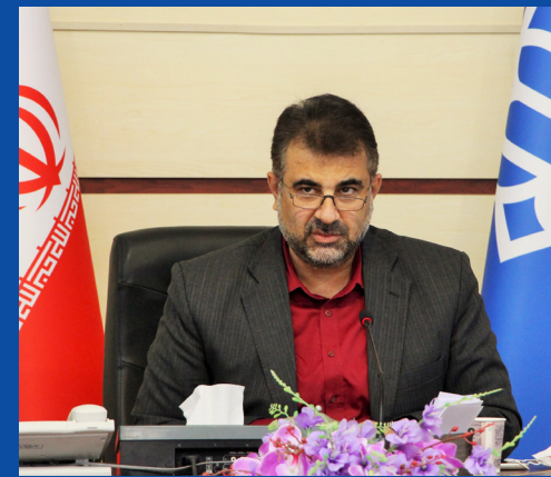
دانشگاه باید اتاق فکر منطقه و نظام جمهوری اسلامی باشد