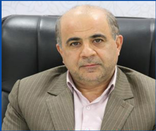
بررسی بحران آب در دشت کاشان و زمینه های ورود خیرین به طرح های احیای آب کاشان