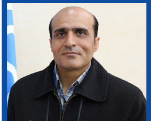
انتخاب عضو هیأت علمی دانشگاه کاشان به عنوان یکی از ۱۰۰ محقق سرآمد علمی کشور