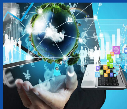
انجام بیش از ۳۱ میلیارد ریال طرح پژوهشی دانشگاه کاشان با صنایع و سازمان های بیرونی