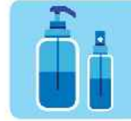
استفاده از مواد ضد عفونى کننده