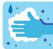
شست و شوى مکرر دستها