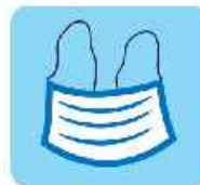
استفاده از ماسک