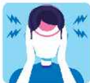
سردرد هاي شديد