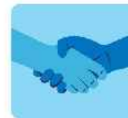
پرهيز از دست دادن و روبوسى