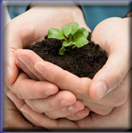
نوابستانان دانشگاه کاشان هزینه جشن ارتقای خود را به بیماران کرونایی اهدا کردند