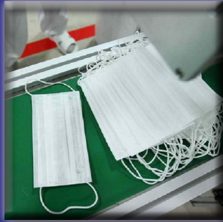
تولید روزانه بیش از ۱۰۰ هزار ماسک توسط دانش آموزان دانشگاه کاشان

روابط عمومی دانشگاه کاشان ■ خبرنامه الکترونیکی شماره ۵۲ ■ شماره پیاپی ۸۴ ■ اسفند ۹۸ و فروردین ۹۹