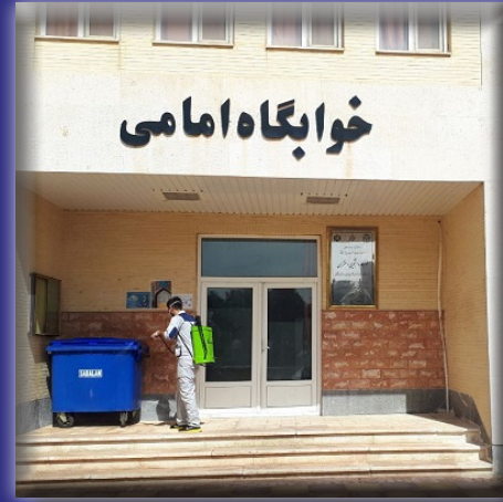
عملیات نظافت و ضد عفونی کلیه بخش های دانشگاه