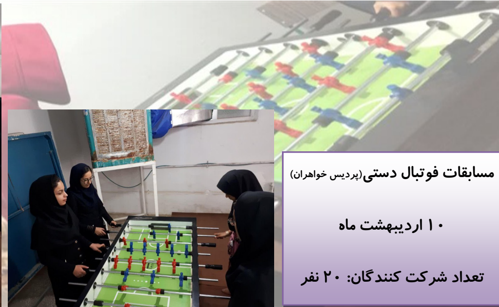
مسابقات فوتبال دستی (پرديس خواهران)