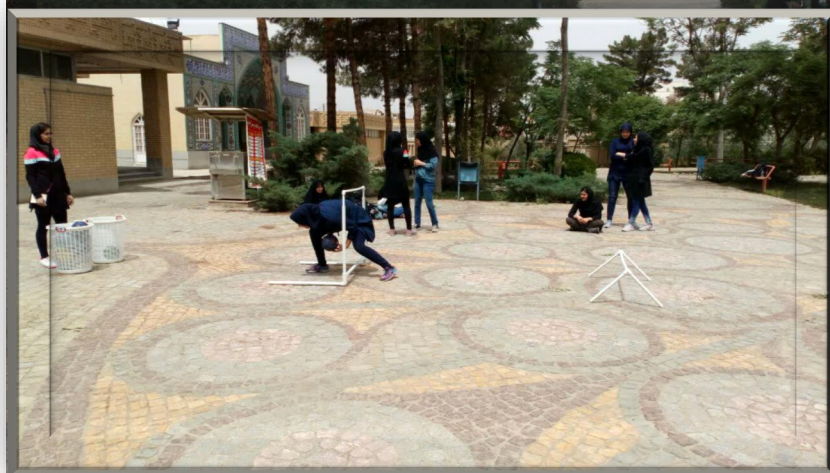
مسابقات توپ امدادی (پرديس خواهران) ۱۷ اردیبهشت ماه تعداد شرکت کنندگان: ۴۴ نفر